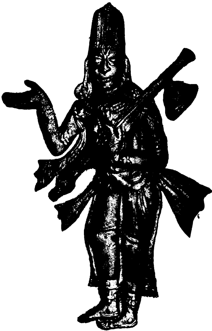
శ్రీ కాళహస్తికి వెద తిరుమలాచార్యులు